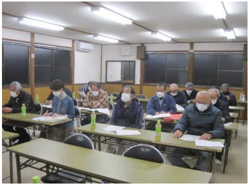
【時期】 4月 【内容】 農業用施設の点検計画を立てた。 また、農業者との意見交換会を実施した。