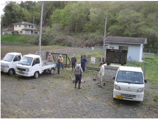
【時期】 6月 【内容】 刈払機による除草作業前に、「機械の安全使用に関する研修」を実施した。