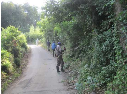
【時期】 7月 【内容】 地域住民と共同で畦畔・法面等の草刈りを行った。