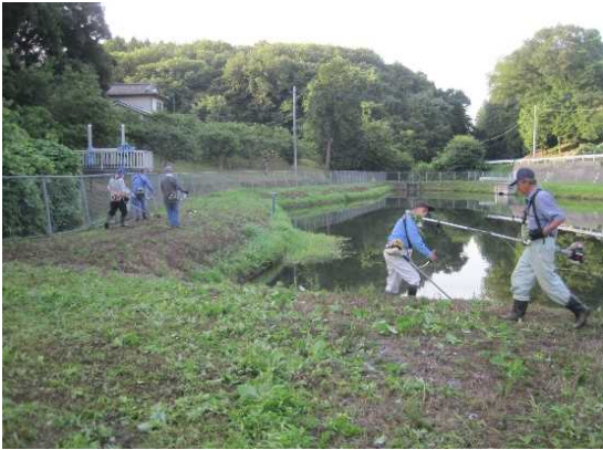
【時期】 4月・5月・6月・7月・8月 【内容】 刈払機によるため池・農道・水路の除草を行っている。