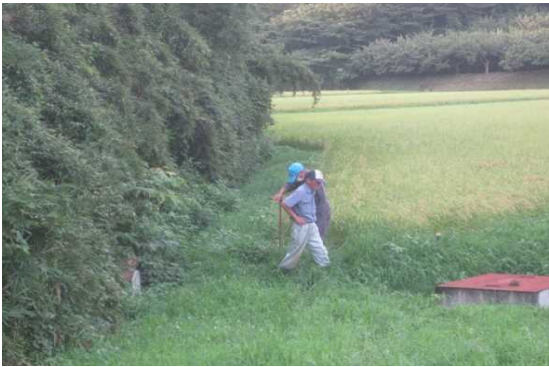
【時期】 年間を通しての維持管理 【内容】 維持管理として定期的な点検及び見回りを行っている。