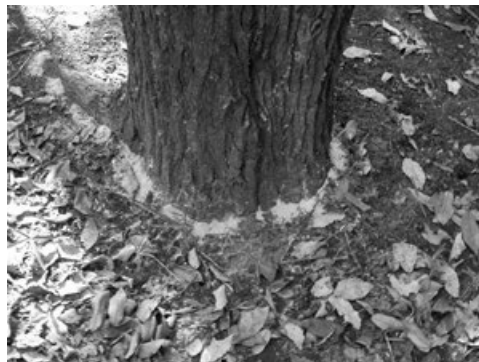
カシナガの穿孔孔とフラス