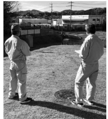
「エコフロンティアかさま」入口