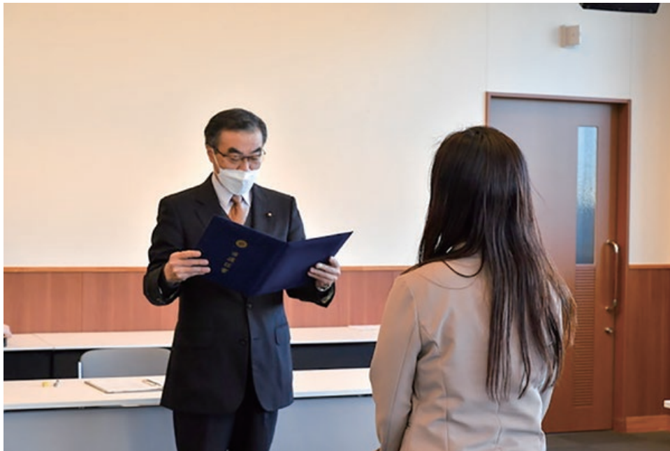
笠間市選挙管理委員会委員長から当選証書を付与

昨年12月の笠間市議会議員一般選挙において、22名の議員が誕生しました。厳しい選挙戦を戦い抜き、当選された皆さんにお祝い申し上げます。