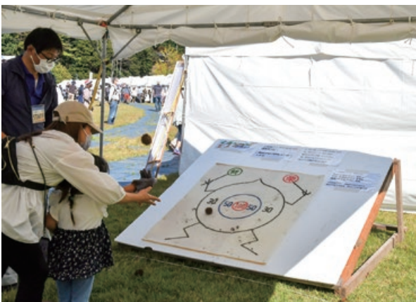
新栗まつりならではの「いがりダーツ」

各店舗も行列が絶えることなく、本当に多くの皆さんにお越しいただきありがとうございました。