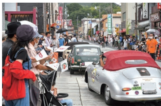
クラシックカー通過の様子