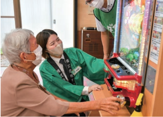
トレーニングパチンコの様子

パチンコが初めてという方にも、スタッフの皆さんが丁寧に教えてくれて、「とても楽しかった」という声や、いきいきとした笑顔が印象的でした。