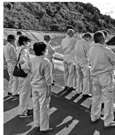
問 資源循環課 (内線129)