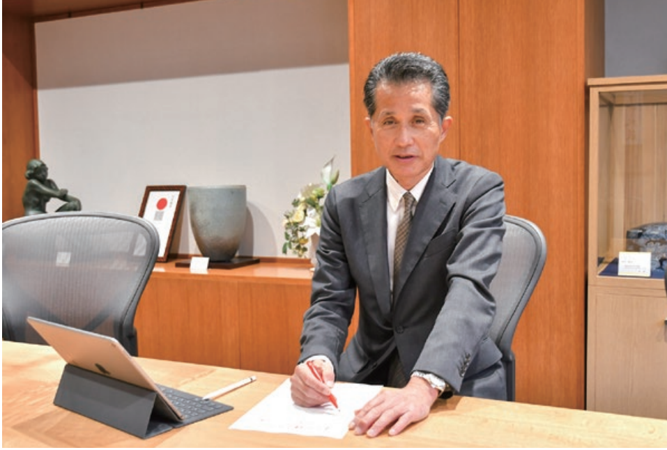
市長室にてコラム執筆中

市長就任後に職員から「広報紙にコラムを書いてみませんか」と声をかけられ、書き始めてから200回となりました。よく続いたと思います。締め切りが近づくと、ここ数年は何を書こうかと迷います。テーマが決まれば20分くらいで書き上げることができるようになりましたが、考える程テーマが出てきません。