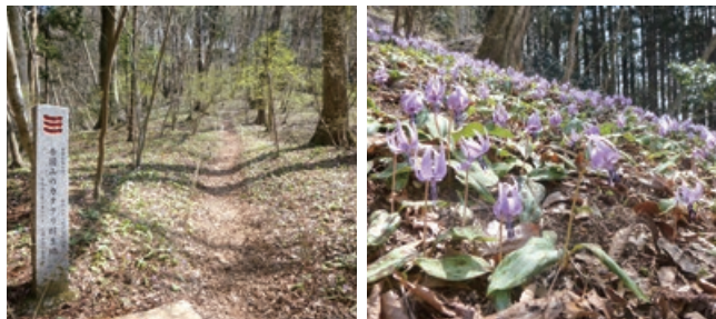
吾国山のカタクリ群生地

カタクリは4月初旬頃に葉を広げ、淡い紅紫色の花を咲かせます。来春には、ぜひ可憐な花を楽しんでいただくとともに、カタクリの保護にご協力をお願いします。