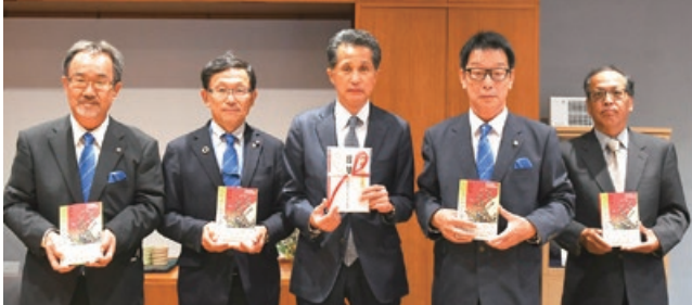
笠間ライオンズクラブの皆さん

本は、市内の小中義務教育学校、高校、図書館にそれぞれ置かれています。皆さんもぜひ読んでみてください。