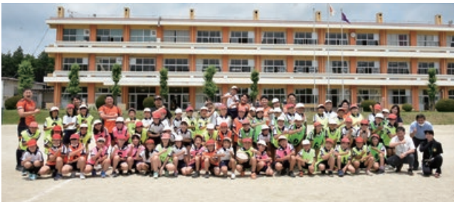
子どもたちと日立製作所ラグビー部の皆さん

この日は保護者が授業中だけでなく休み時間なども選んで参観できるフリー参観日。駐車場等の案内係として学校支援ボランティアも活躍していました。