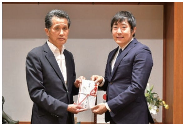
(写真左から) 山口市長、株式会社栃雪 町井代表取締役