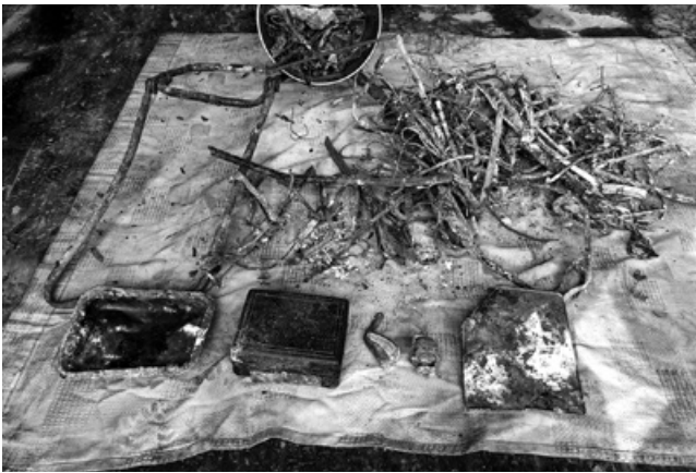
市環境センターから発見された金属類

ごみ処理設備の修理には多くの時間と費用がかかり、ごみ処理が滞ることで皆さんに多大なご迷惑をおかけすることになりますので、ごみの適正な分別・排出にご協力ください。