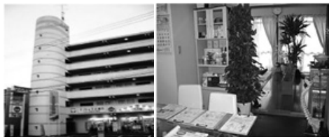
県立中央病院前マンション6F