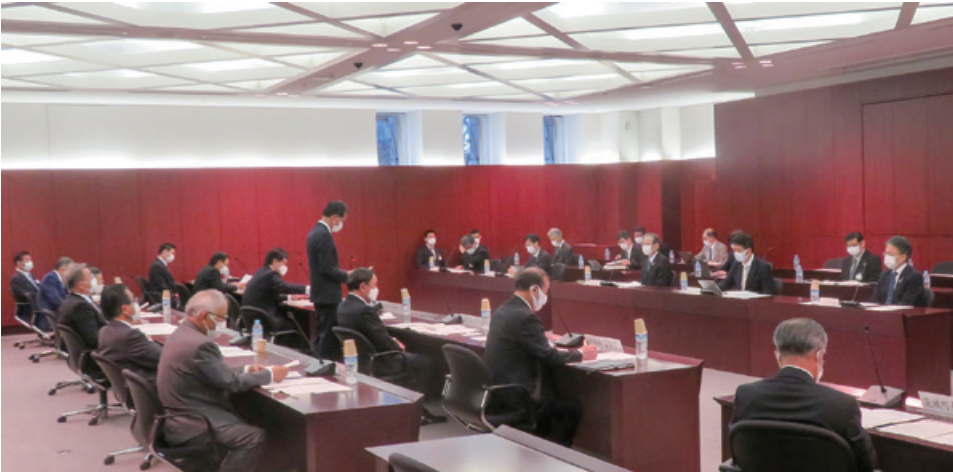
茨城県市長会等4団体と知事との懇談会（令和3年10月）

茨城県市長会は県内32の市で構成されている団体です。私は令和元年から会長職を務めています（任期は1期2年です）。事務局は茨城県市長会です。