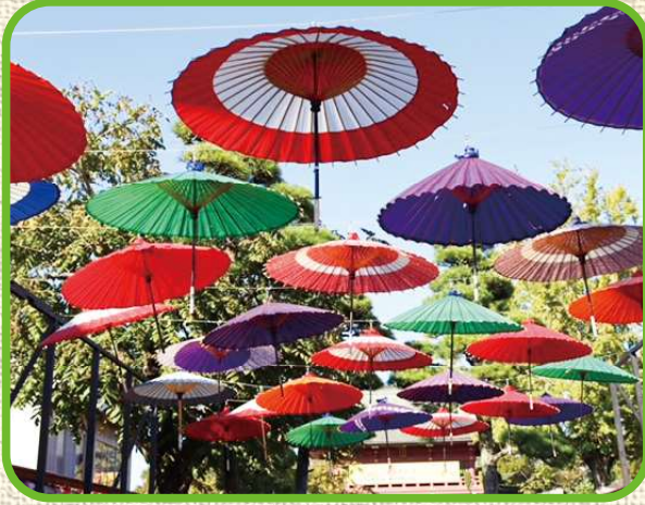
空にいっぱいの傘