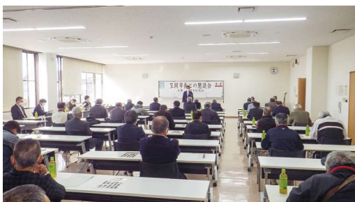
区長会主催の市長との懇談会

答 総務部長 今後もきめ細やかな行政サービスを提供していくためには、市から地域住民への情報提供と要望の収集をさらに進めていかなければならない。その対策として、役員の負担軽減、文書による情報伝達方法及び行政区の業務の見直しを行う必要性から、デジタル技術を取り入れた新たな手法等、先進事例の調査研究を進める。行政区の統廃合を推進していくことも必要と考えるが、区長会とも連携をしながら、望ましい形の組織運営が構築できるよう努める。行政区を通じて行う各種団体の募金の募金要請、会費等の徴収など、市役所内部関係各課による協議を始める。