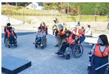
プレーメンの調査隊事業 UDのまちづくりの取り組み

答 市長公室長 男女共同参画の推進や女性活躍、多様な生き方の推進、いばらきパートナーシップ宣誓制度による性的マイノリティへの支援等で、市内企業等へのいばらきダイバーシティ宣言の登録勸奨、ユニバーサルデザイン（UD）の推進、市民向け講座などを開催する。