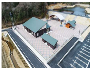
大きな役割を担う福ちゃんの森公園

答 市長 堂ノ池周辺整備事業の大きな目的の一つに、地域の状態を解消することがあった。現在は、地域の融和が図られ、分断状況ではない。公園は利用者が多い状況ではないが、交流の場づくりになるような形を求め、取り組んでいきた。