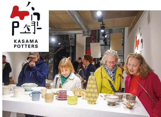
イギリスの展示会の様子と笠間焼ブランドロゴ

ランドとして確立していく。若手作家による英国の陶芸産地との人事交流を行うことで、笠間焼のさらなる認知度向上に努める。英国を起点として欧州全体に情報が発信されることで新たな販路開拓につなげたい。