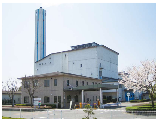
市内全域が処理対象となる笠間市環境センター

含めた改正を行う。令和4年4月1日から笠間地区の直接搬入するごみは環境センターで処理することとし、令和5年4月1日からは笠間地区の一般家庭から集積所に搬出された可燃ごみも環境センターで処理を開始し、市全域の一般廃棄物を集約した処理体制を構築する。