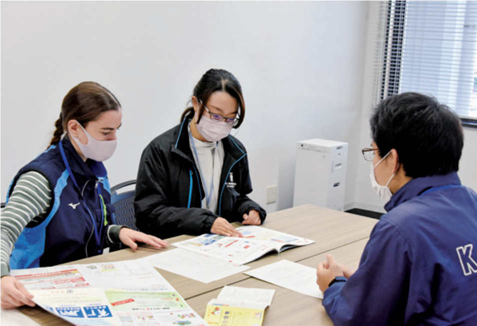
外国人採用職員との打ち合わせの様子

市職員や農業公社職員、市が関わる会社である（株）道の駅笠間や笠間栗フアクトリー（株）の社員、地域おこし協力隊員など人材の確保が厳しい状況が続いています。