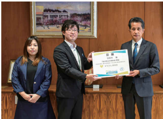
左から、明治安田生命水戸支社笠間営業所 大塚支店マネージャー、関原所長、山口市長

昨年に引き続き、「私の地元応援募金」として、従業員の方々の募金と会社からの寄附により贈られたものです。寄附金は基金に積み立て活用させていただきます。ご厚意に感謝申し上げます。