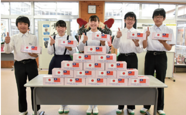
笠間中学校生徒会の皆さん

市内の小中学校および義務教育学校に配布し、有事の際の備品として有効に利用させていただきます。ありがとうございました。