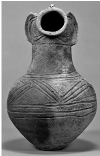
国指定重要文化財 顔面付土器 (明治大学博物館蔵)

土偶や人物埴輪、人面がついた壺など、人々は顔のついた器や人形などを作ってきました。本展では、主に県内から出土した顔のついた資料を紹介し、それぞれの時代に作られた顔について、その目的や性格について考えます。