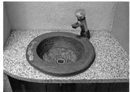
使用例：床タイル、壁材、洗面ボウル、表札 等