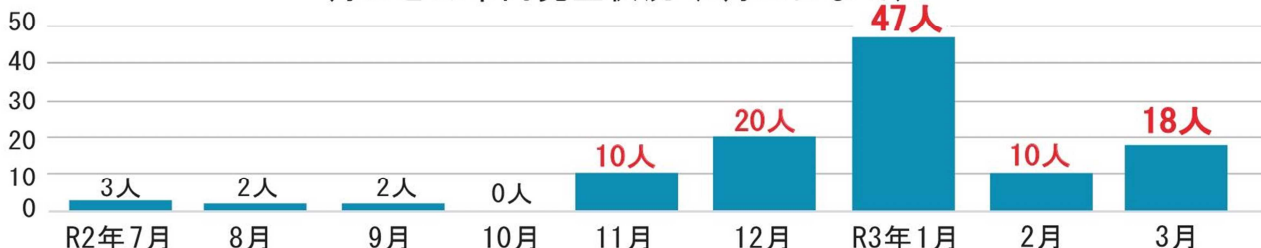
月ごとの市内発生状況 (3月30日まで)

年度初めは会食などが增える時期です。感染症拡大防止のため、気を緩めることなく、引き続き感染症対策にご協力いただきますようお願いいたします。