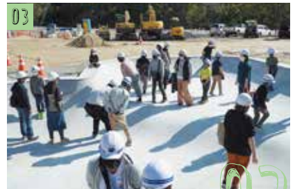
スケートパークを見学する参加者の皆さん