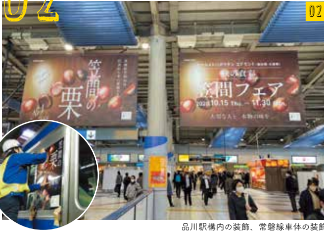
品川駅構内の装飾、常磐線車体の装飾

笠間市とJRの連携による栗プロモーション事業の一環として、東京・品川・友部・岩間の各駅構内と常磐線の車体で、笠間の栗の装飾が行われました。また、上野・東京駅構内のデジタルサイネージや、山手線等のトレインチャンネルでは、笠間の栗CMが放映されました。常磐線の車体装飾は3月中旬まで実施しています。