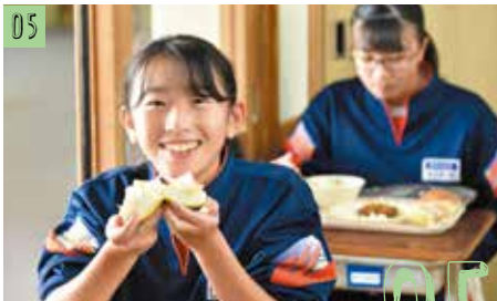
岩間中学校での給食の様子