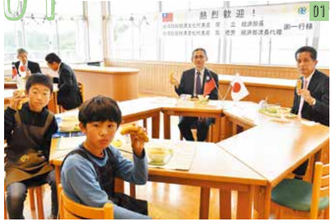
大原小学校での給食の様子

昨年から行われている、台湾と笠間の食を通じた文化交流。今年も、笠間市・水戸市・大洗町にひたちなか市が新たに加わり、小中学校や保育園など計43施設で、約12,000本のバナナが提供されました。