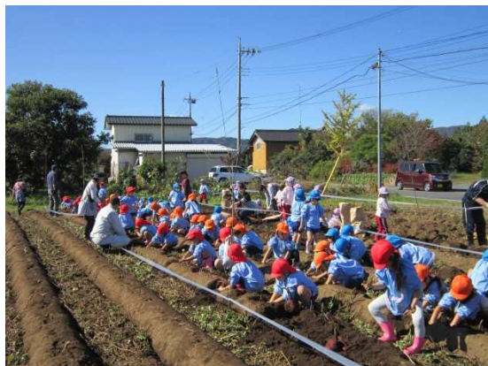
わくわくしながらのさつまいもほり！