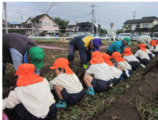
園児と農業委員との共同作業！