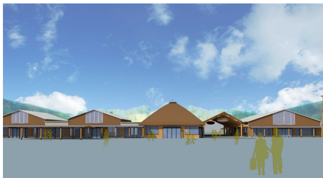
道の駅（イメージ図）