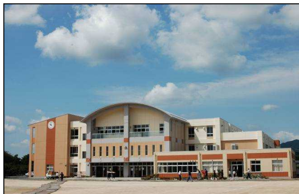
岩間中学校の新校舎