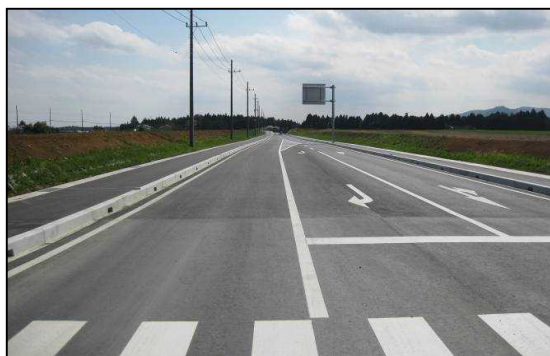
市道友部1級12号線（平町・矢野下地内）