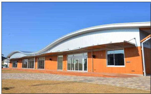
地域交流センターともべ