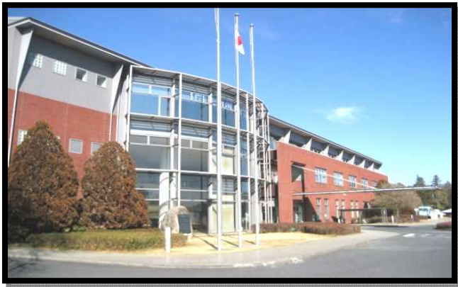
市民センターいわま