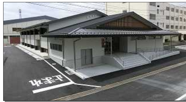
笠間中学校武道場