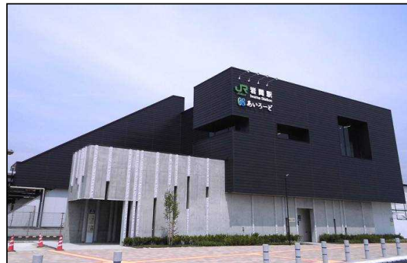
岩間駅駅舎・自由通路