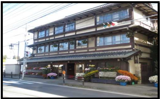
笠間稲荷周辺まちづくり拠点整備