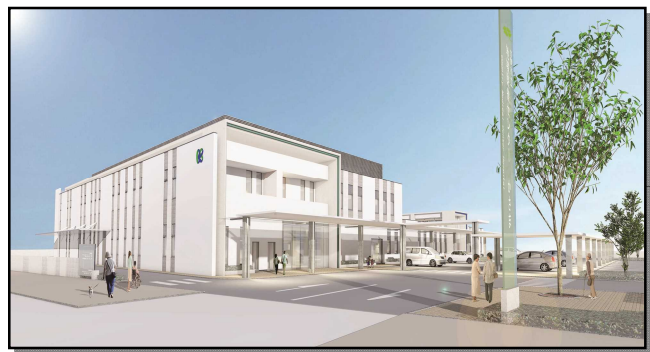
地域医療センターかさま【イメージ図】