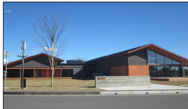
地域交流センターいわま