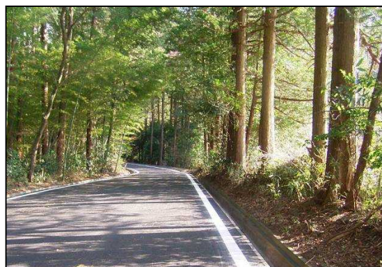
舗装された林道本戸前山線