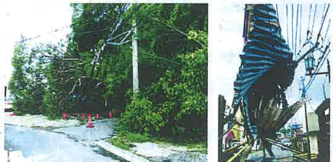
2019年台風15号襲来時の実際の被害の様子

ビニールやトタン、 樹木等が電線に引っかかると 長期間の停電の原因になる 場合があります