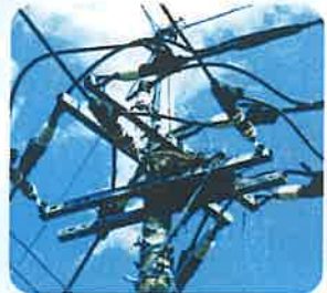
カラスの巣がある