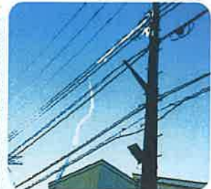
電線にビニールが 引っかかっている