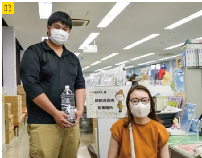
▲除菌消臭液を受け取ったご夫婦