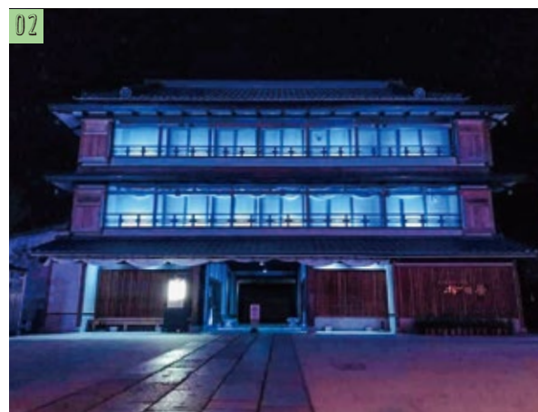
▲ブルーライトアップを行っているかさま歴史交流館井筒屋

最前線で昼夜を問わず働いている医療従事者の方へ、感謝と応援の気持ちを込めて、ブルーライトアップを行っています。