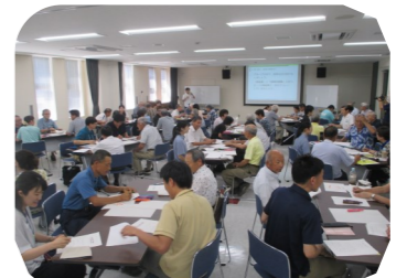
地域についての話し合い 情報共有の場『協議体』