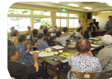
支えあいが生まれる場 ふれあいサロン