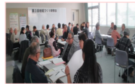
地区別話し合い体験

生活支援体制を進めるために地域について話し合う場を「協議体」といいます。住民が主体となり行政や社会福祉協議会、福祉施設や企業も一緒に考えるところが協議体の特徴です。