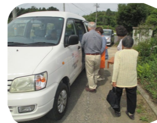
福祉施設による 移動支援