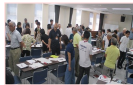
話し合いの進め方勉強会