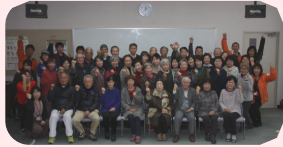
R1.12.2 コミュニティサロン運営者交流

ふれあいサロンは身近で気軽に集まれる場所です。地域の方々の力で生まれその活動は徐々に市内に広がっています。ふれあいサロンの中では、お互いに体調を気遣う声や近況を報告しあう声が聞こえ、少しずつではありますが支えあう姿が自然と生まれています。サロン活動は集いの場を超えて、地域の支えあいづくりの場として期待される活動です。