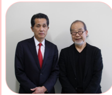
山口市長と鎌田實先生