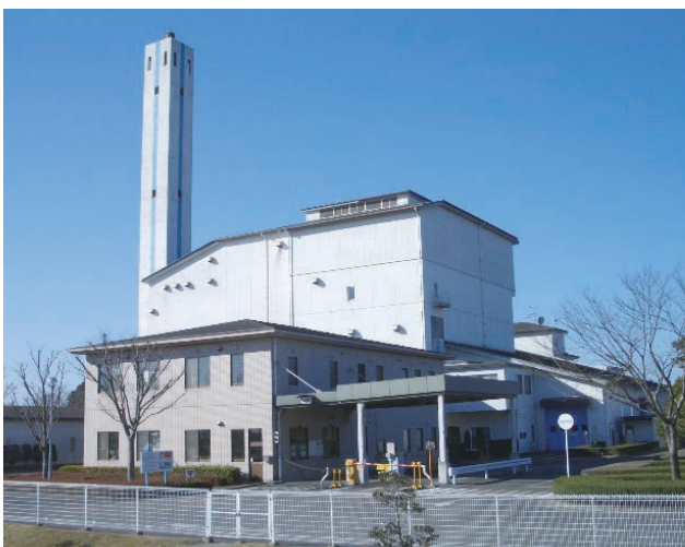
柏井地区にある環境組合の焼却施設

議案第110号 笠間・水戸環境組合の解散について 議案第111号 笠間・水戸環境組合の解散に伴う財産等の処分について