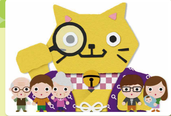
イメージキャラクター「かくにゃん」