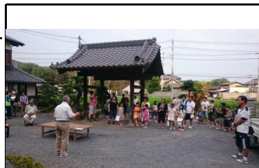
国指定天然記念物ヒメハルセミ観察会

地域内には、国指定天然記念物のヒメハルセミが生息しています。観察会を実施し、あらためて、自然環境の大切さを実感することが