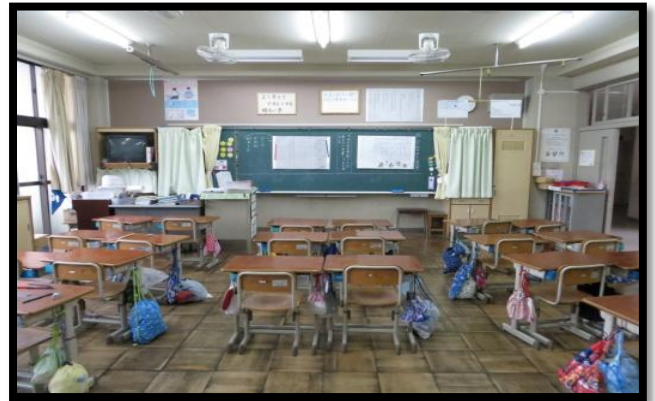
中学校校舎エアコン設置