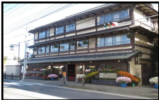
笠間稲荷周辺まちづくり拠点整備