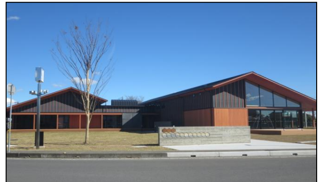
地域交流センターいわま