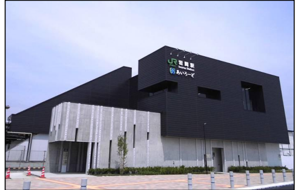
岩間駅駅舎・自由通路