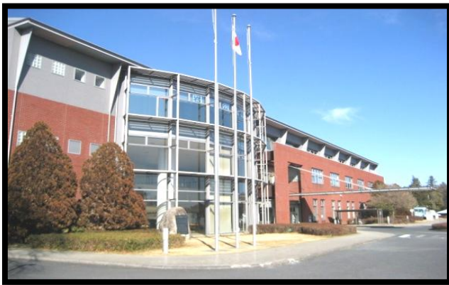
市民センターいわま