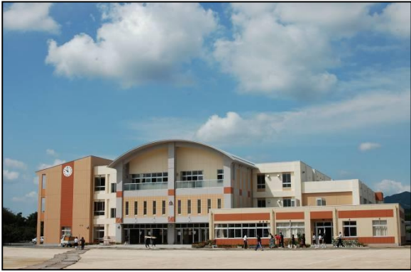
岩間中学校の新校舎