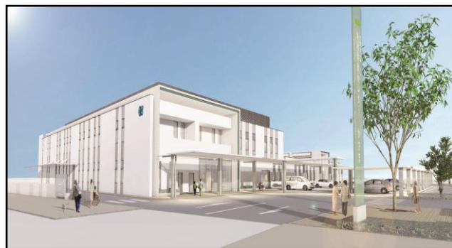
地域医療センターかさま【イメージ図】