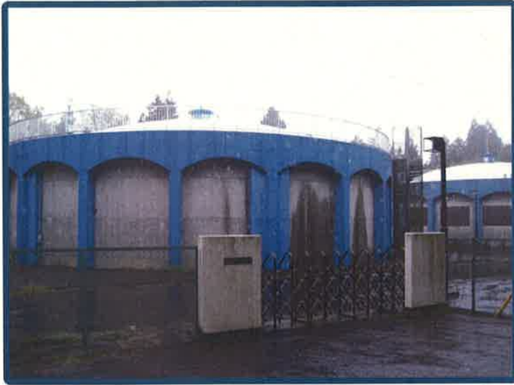
箱田配水池 【P C造 2,500 \text{m}^3 ×2基】