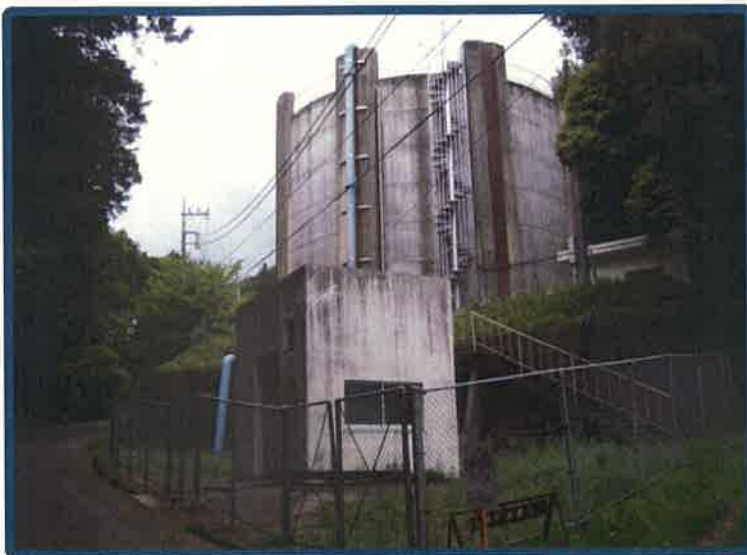
愛宕配水池 【P C造 2,000 \text{m}^3 】