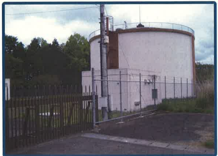
南友部高区配水池 【P C造 3,000 \text{m}^3 】