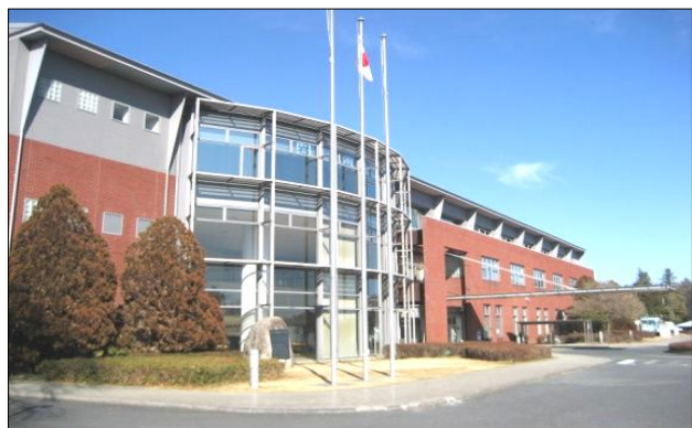
市民センターいわま