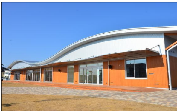
地域交流センターともべ