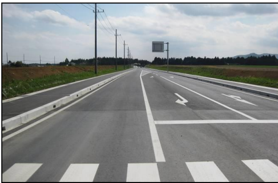
市道友部1級12号線（平町・矢野下地内）