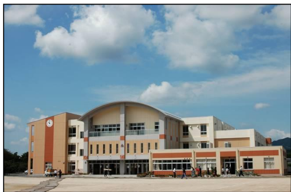
岩間中学校の新校舎