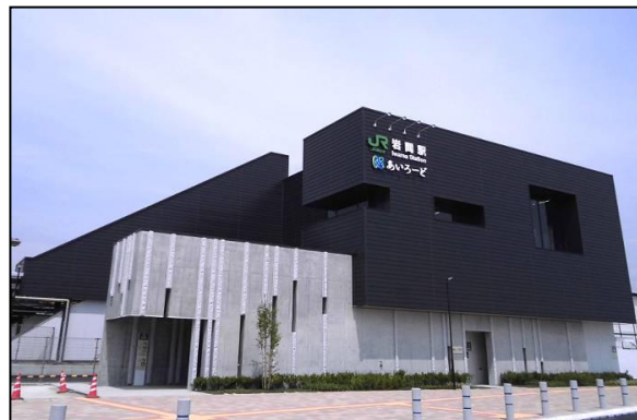
岩間駅駅舎・自由通路