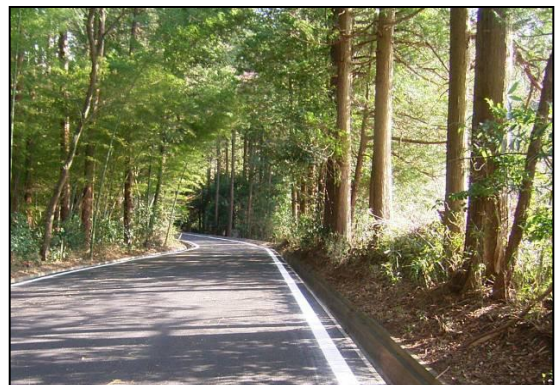
舗装された林道本戸前山線