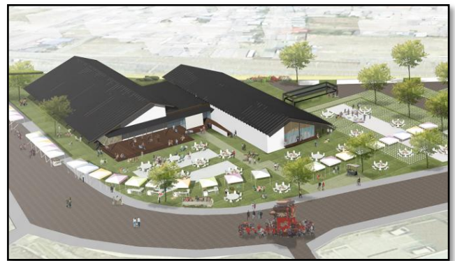
地域交流センターいわま【イメージ図】