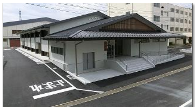
笠間中学校武道場