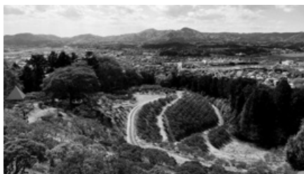
「里山都市」笠間を感じる風景(つつじ公園から)