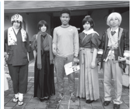
外国人と街歩き (工芸の丘でタイのロータリー交換留学生)

8日(土)、15日(土)、22日(土)(友部公民館 午前10時～) ※外国人相談も受け付けています。