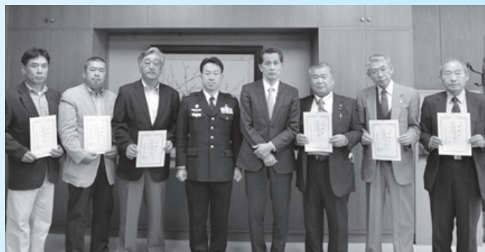
委嘱状を交付された自衛官募集相談員の皆さん