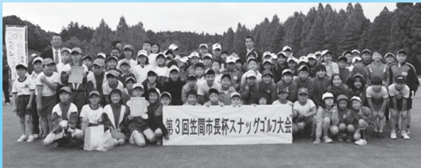
出場した選手の皆さん