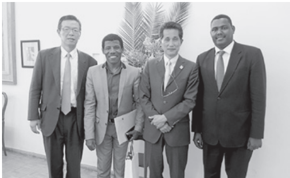
(左から) 齋田大使、ハイレ・ゲブレセラシエ陸連会長、山口市長、マルコス前駐日大使

今回、内閣官房東京オリンピック・パラリンピック競技大会推進本部事務局のエチオピア訪問に合わせ、5月7日から10日までエチオピアを訪問してまいりました。現地では日本大使館、国際協力機構(JICA)職員とも合流し、