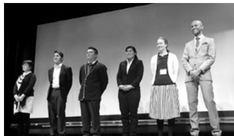
平成28年度かさま国際シンポジウム

この表現を直訳すると「足を折れ」となりますが、実際は「がんばってください」という意味です! 語源は諸説ありますが、一説によると、舞台関係者の間で出演者に「Good luck!」(幸運を祈るよ!)と言うと、逆に「bad luck」を招いてしまうという迷信があり、「Break a leg!」と言うようになったと考えられています。