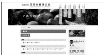
笠間市農業公社ホームページ( http://www.kasama-agri.jp/ )