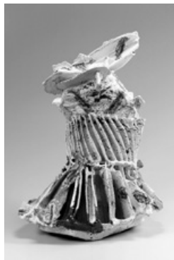
井上雅之「NT-171」 2017年 大賞・桂宮賜杯