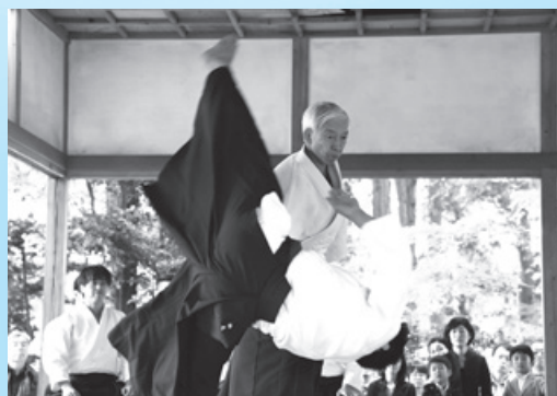
合気神社例大祭で披露された道主の演武

合気道は、今後開催されるいきいき茨城ゆめ国体2019のデモンストラレーションスポーツとして決定しています。地元根付く心身鍛錬のための和の武道を盛り上げていきましょう。