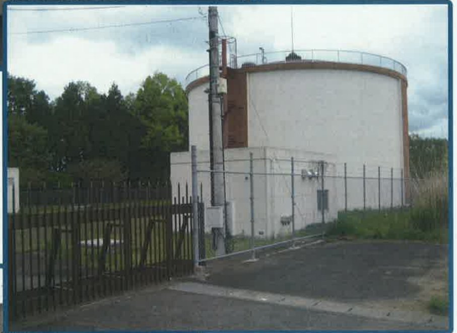
南友部高区配水池 (PC造 3,000m 3 )