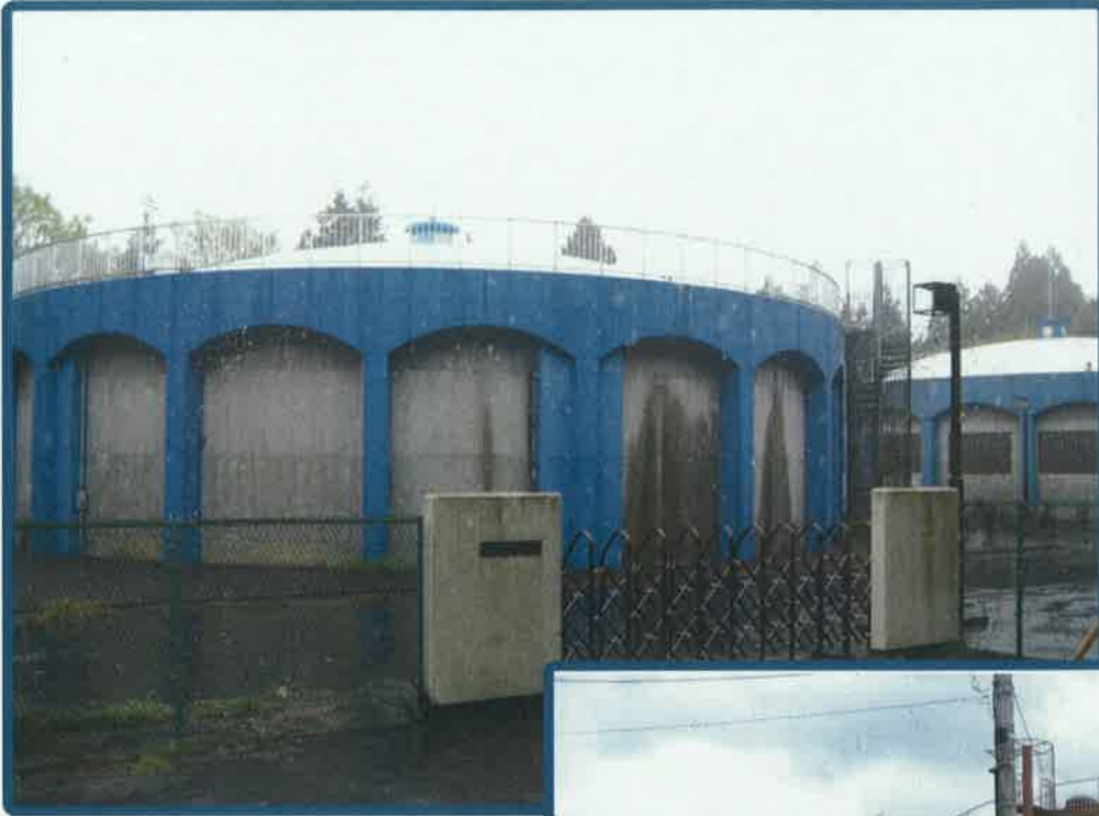
箱田配水池 (PC造 2,500m 3 × 2基)