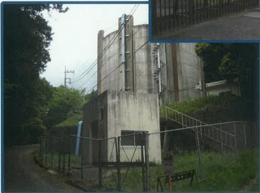
愛宕配水池 (PC造 2,000m 3 )