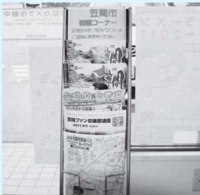
設置された情報コーナー