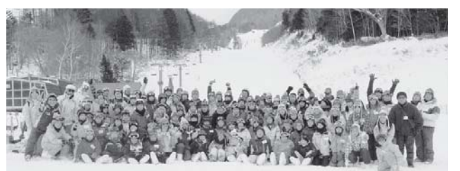
楽しい思い出がたくさんできました