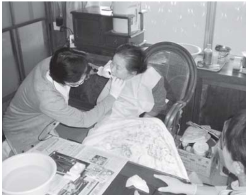
入れ歯の調整をしている様子

この事業は、病気や高齢のために寝たきりになり、歯科医院に通院できない自宅で療養している方が対象です。