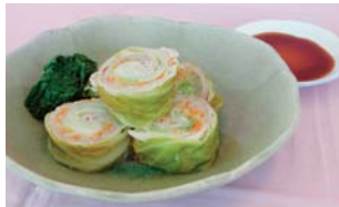
主菜：今月のレシピ