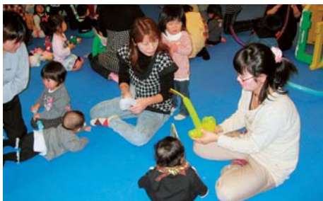
お楽しみ会の様子（H23.12.19くりのこ）