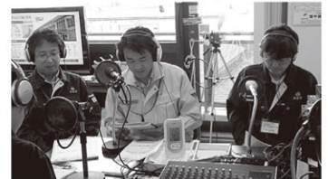
みやこ災害FMに出演し、義援金のお知らせをした。