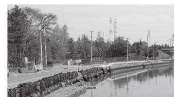
車が通れるまでに復旧した道路