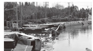
震災直後の被災した道路