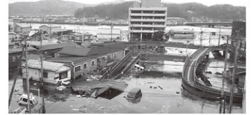
津波により孤立した市役所

仮設住宅入居者との連絡調整や被災者生活再建相談。義援金の受領や給付事務と支援物資等の受入れ・配布など。