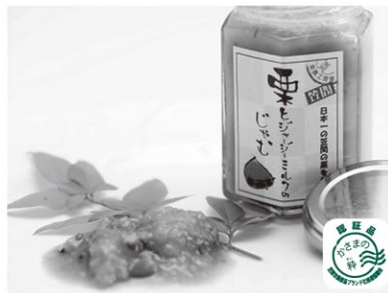
栗ジャム 販売者/ 笠間クラインガルテン楽農工房