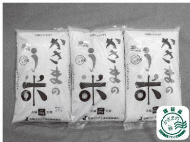
特別栽培米「かさまのうめ」1kg 販売者/ JA茨城中央稲作部会