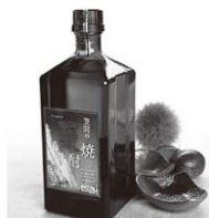
笠間の栗焼酎三年古酒 (34度原酒)

その他の「かさまの粋」商品17品については、 笠間市公式ホームページをご覧ください。