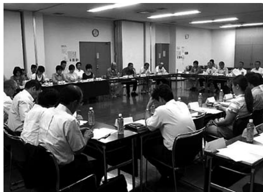
第1回学校統合準備委員会の様子

7月、統合関係校の保護者、教員、地域の代表等から構成される笠間市立小中学校統合準備委員会が小学校、中学校それぞれに発足しました。小学校統合準備委員会33名、中学校統合準備委員会16名の委員が各部会に分れて意見を出し合い、子どもたちの心のケア・交流、スクールバス等通学に関する事など、統合に必要な事項・課題について協議を進めています。円滑な統合に向けて、今後も市民の皆さんのご理解とご協力をお願いします。