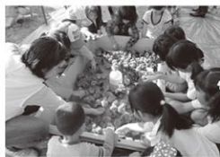
ひよこことふれあいコーナー (昨年の様子)