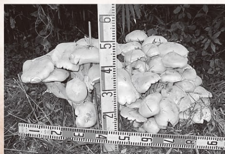
発見されたニオウシメジ

主に沖縄などに分布し、茨城県は北限となるため、笠間で発見されるのは非常に稀であるとのこと。