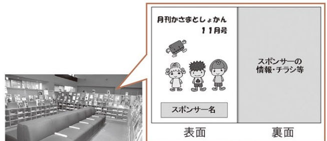
雑誌コーナー(笠間図書館)