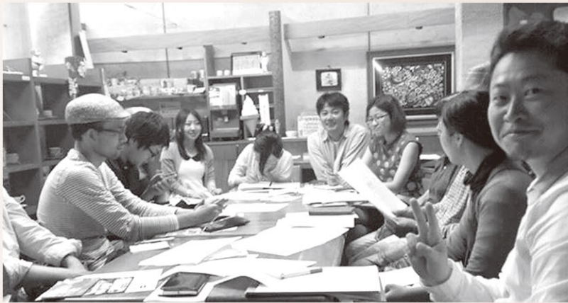
和気あいあいのミーティング