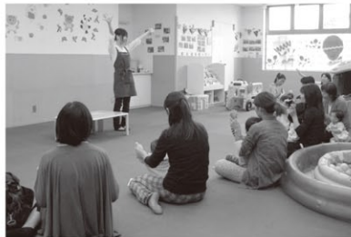
0～3歳向けおはなし会の様子

赤ちゃんから楽しめる絵本や紙芝居の読み聞かせのほか、わらべうたやうた遊びを紹介しています。参加は自由です。ぜひお越しください。