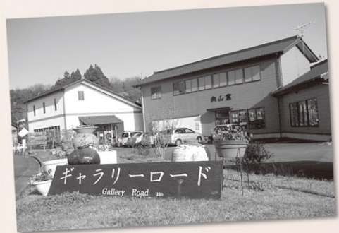
ギャラリーロード