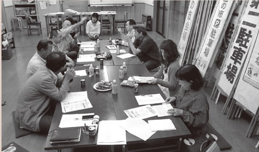
「道の市」の打ち合わせの様子