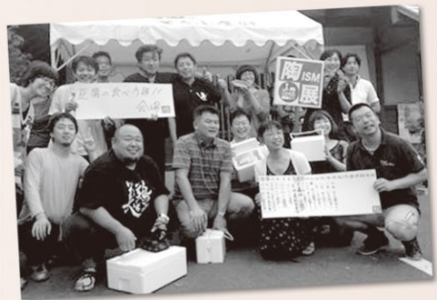
陶ISM in KASAMA