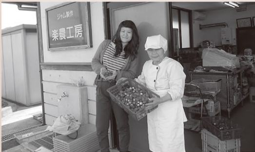
笠間の資源を探索中!

ブログやフェイスブックもご覧ください。 http://ameblo.jp/kasamart-wa/ https://www.facebook.com/Kasamartowa