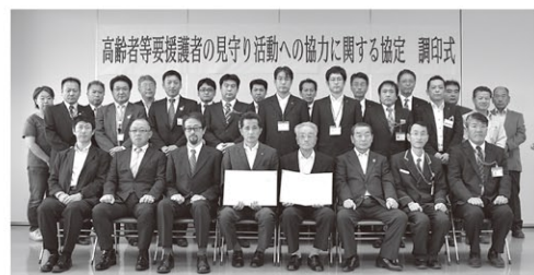
笠間市と市内外の36事業者が見守り協定を締結

今後ますます安否確認が必要な高齢者等が増加する中、笠間市では地域に根ざした活動をする事業所にご協力をいただき、安心して暮らせる地域づくりを進めていきます。