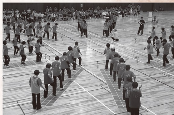
スクエアステップの様子