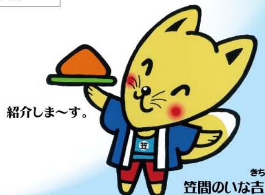
きち 笠間のいな吉