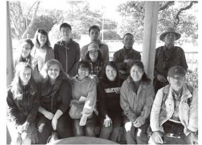
飯田ダムハイキング&バードウォッチング