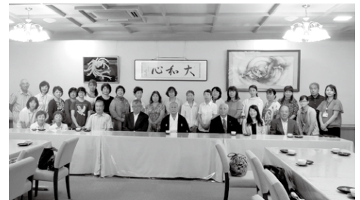
国際交流県外研修 (香取神宮内)