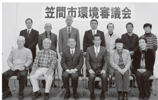
環境審議委員の皆さんと山口市長

審議会は、平成26年12月に第1回目の会合を行い、市環境基本計画推進会議やかさま環境市民懇談会などで計画案を議論しました。本計画の特徴は、重点事業をかさま環境市民懇談会が中心となり、市民・事業者・行政が一体となって推進することにあります。今後、的確な計画の進行管理を行っていきます。