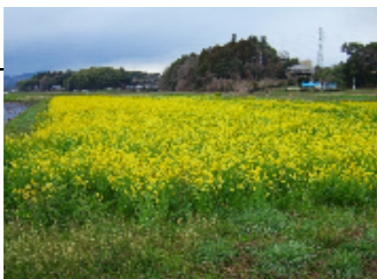
菜の花満開 (景観形成)