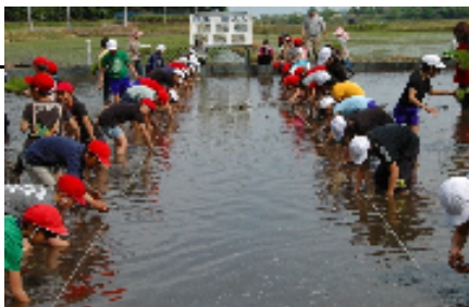
北川根小学校児童による田植え(子供たちに手で苗を植える伝統技術を伝えています)