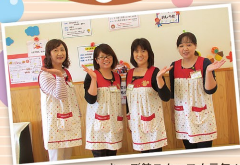
キッズ館スタッフも元気！