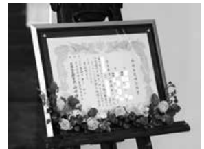
活用例(ウェルカムボード)