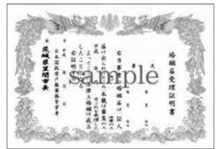
婚姻届特別受理証明書(B4版)

なお、申請されてから作成するため、発行までに数日かかる場合がありますので、ご了承ください。発行要件等の詳細は、お問い合わせください。