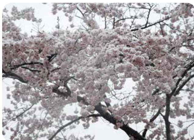
北山公園の雪化粧をした桜