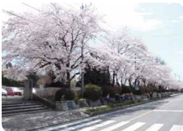
笠間小前の満開の桜