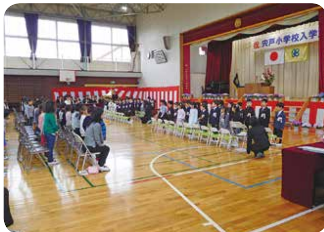
希望に満ちた入学式