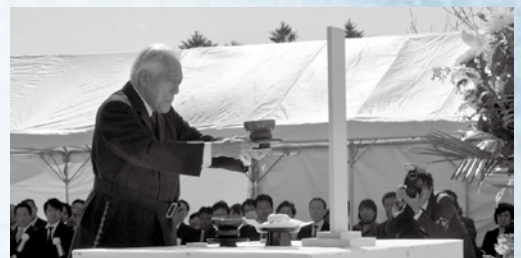
慰霊献茶をする千玄室大宗匠