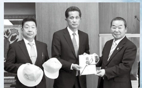
川上会長(右)と左から今泉教育長、山口市長